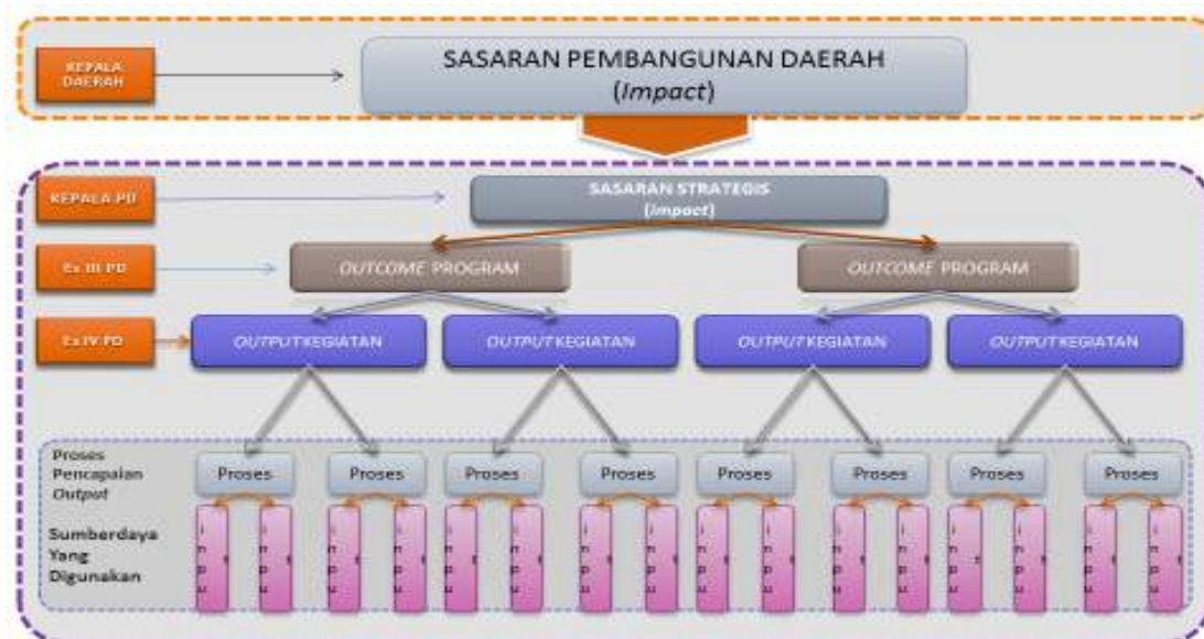
Gambar 6.1. Arsitektur Kinerja Pelaksanaan Tugas dan Fungsi Perangkat Daerah

Untuk mencapai tujuan dan sasaran strategis perangkat daerah dalam rangka mewujudkan tujuan dan sasaran pembangunan daerah, harus ada kejelasan siapa yang bertanggung jawab terhadap pencapaian kinerja pada setiap tingkatan. Arsitektur kinerja dapat digambarkan dalam bentuk pohon kinerja sebagai berikut: